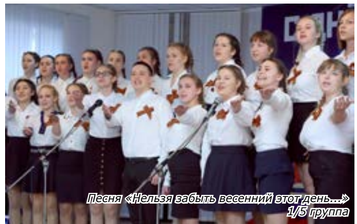
Песня «Нельзя забыть весенний этот день...» 1/5 группа