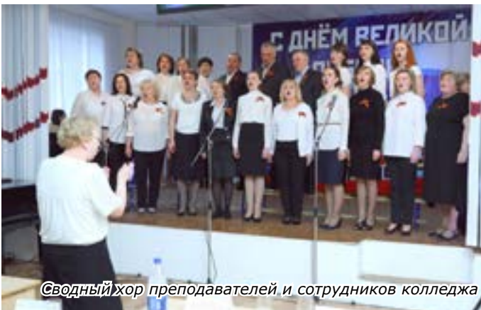
Сводный хор преподавателей и сотрудников колледжа