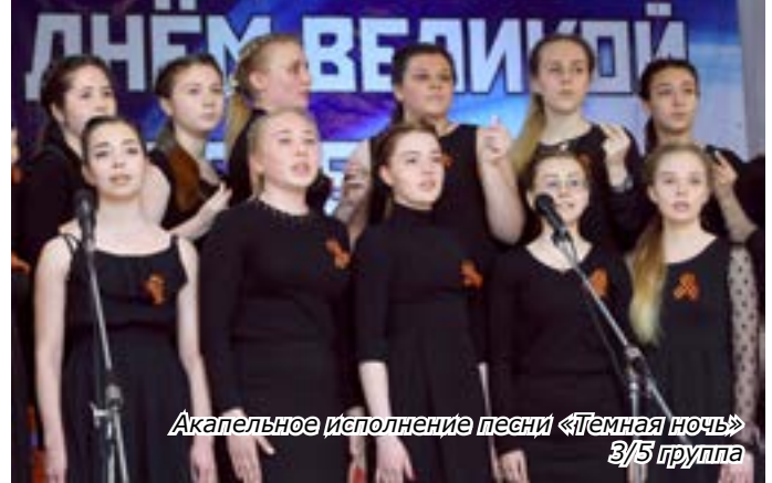
Акапельное исполнение песни «Тёмная ночь» 3/5 группа