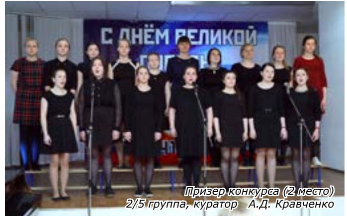
Призер конкурса (2 место) 2/5 группа, куратор А.Д. Кравченко