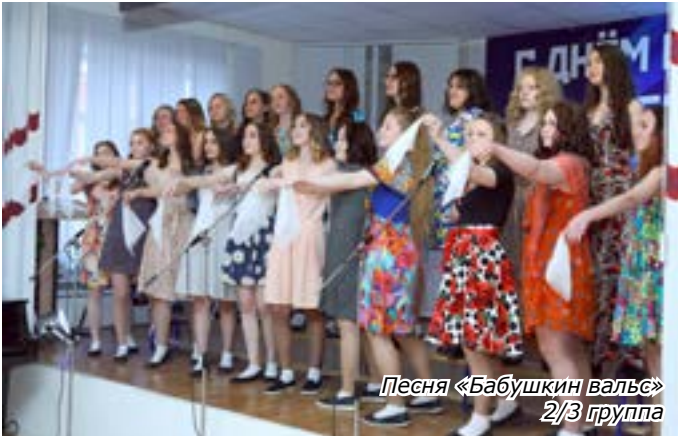
Песня «Бабушкин вальс» 2/3 группа